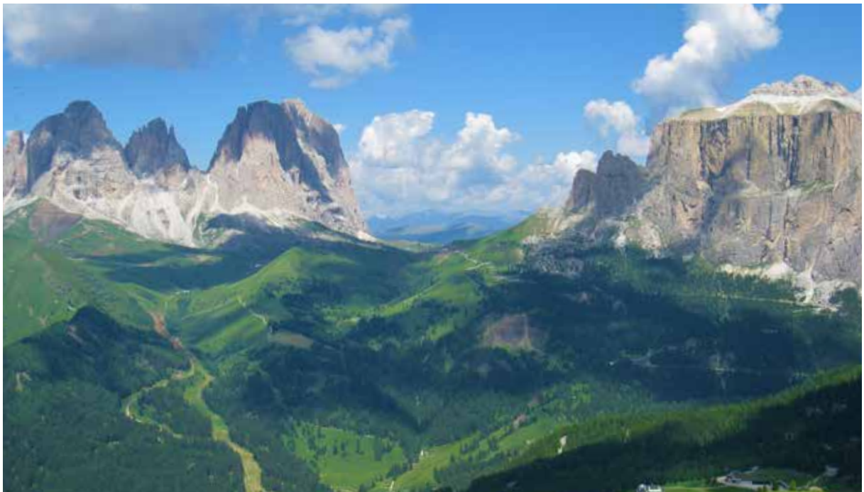
7月8日 ドロミテ周遊 展望台からの望む雄大なドロミテのパノラマ