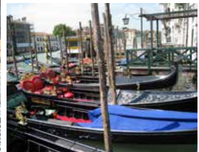
7月5日 ヴェネツィア観光 生演奏付でゴンドラも楽しめます