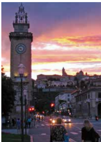
7月9日 ホテル前から見た夕暮れのベルガモ・アルタ(旧市街)